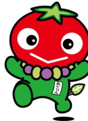
JA 大阪中河内オリジナルキャラクター 「あぐりん」