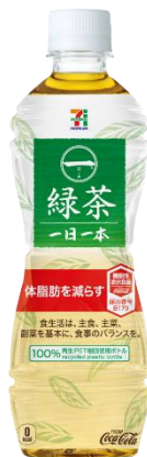
製品名: 「一(はじめ) 緑茶 一日一本」 (機能性表示食品) 発売日: 2019年6月10日(月)

日本コカ・コーラ株式会社と株式会社セブン&アイ・ホールディングスが展開する、完全循環型ペットボトルを使用した共同企画商品「一(はじめ)」シリーズ(継続販売中)。