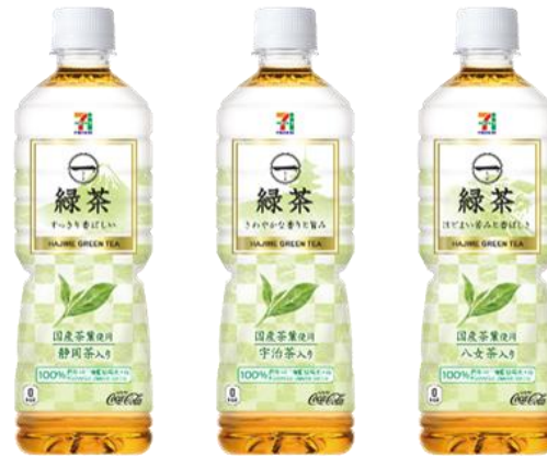
製品名: 「一(はじめ) 緑茶」600ml PET ボトル 左から静岡茶入り、宇治茶入り、八女茶入り 発売日: 2020年4月14日(火)