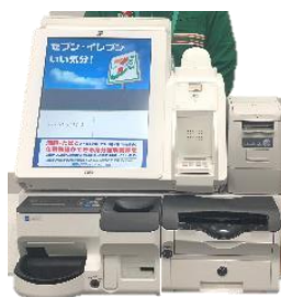
◀セルフレジの導入促進 ※画像はイメージ