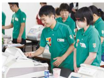
◀レジ・接客研修の様子