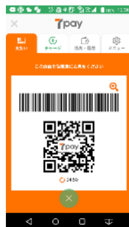
キャッシュレス決済▶ ※画像はイメージ