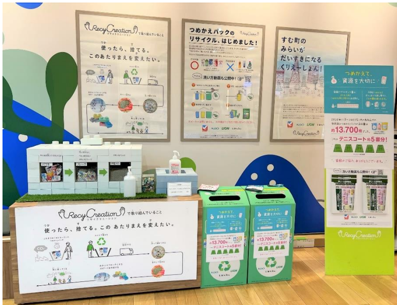
店頭入口の回収ボックスと展示