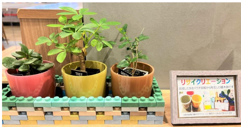
回収容器から再生したプラスチック鉢を利用して店内フードコートにミニ観葉植物を設置

■ 墨田区の区報(2021年8月11日発行)に持続可能な社会の実現に向けた区内事業者の活動として紹介されました。