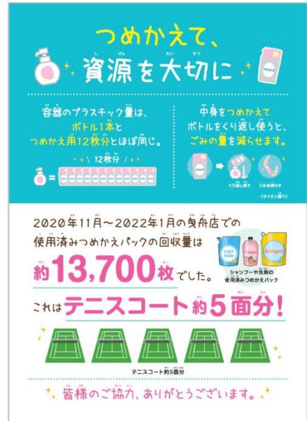
回収量をお知らせするポスター