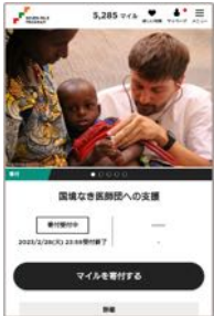
セブンマイルプログラムのWEB画面