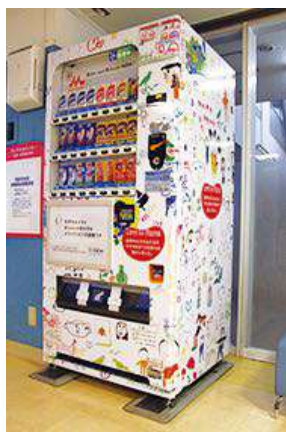
ホワイトリボン支援自動販売機

赤ちゃん本舗とそごう・西武は、国際協力NGOジョイセフが推進している世界中の妊産婦と赤ちゃんの命と健康を守る運動「ホワイトリボン運動」に賛同し、「アフリカ・ザンビアにマタニティハウス（出産待機施設）を贈ろうプロジェクト」を応援しています。店頭やインターネットで募金を受け付けており、2022年2月末現在、店内外に45台（赤ちゃん本舗35台、そごう・西武10台）のホワイトリボン支援自動販売機を設置。飲料の購入1本につき2円（飲料メーカー様1円+設置した事業会社1円）をジョイセフに寄付しています。また、そごう・西武では、2010年よりオリジナルの「ホワイトリボンピンバッジ」を作成し、収益全額を「ホワイトリボン運動」に寄付しています。