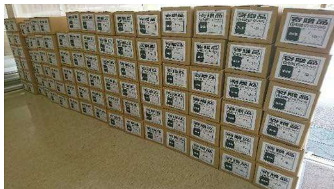
商品寄贈による社会貢献