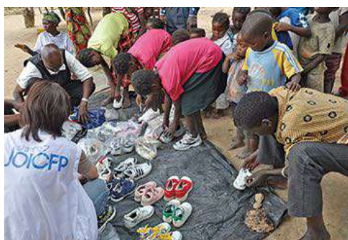
贈られた靴を選ぶザンビアの子どもたち

※ 途上国の女性、こどもの命と健康を守る活動をしている日本生まれの国際協力NGO