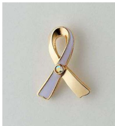
2021年 ホワイトリボンピンバッジ