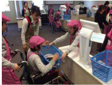
伊藤研修センターでのレジ接客体験学習

セブン&アイグループの研修施設、伊藤研修センターでは、売場づくりや食品加工を体験していただくほか、車いすのお客様への対応など、さまざまなお客様の立場に立った対応について実際に体験学習する機会を提供しています。それらの体験を通じて、働くことの意義やお客様に接する喜びなどを感じていただけるように努めています。