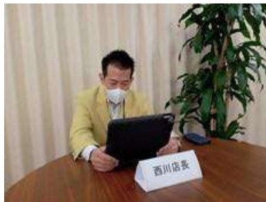
オンライン会議ツールでの職場体験の様子（イトーヨーカドー）

ヨークは、店舗での食品加工作業の見学や売場での商品の陳列などを体験する場を提供しており、毎年約7,000人の小・中学生が参加しています。2021年度は、新型コロナウイルス感染状況を注視しながら、児童・生徒の見学や先生からのインタビューを受け入れたほか、教育機関に自社の社会・環境への取り組みを掲載しているリーフレットを提供しました。