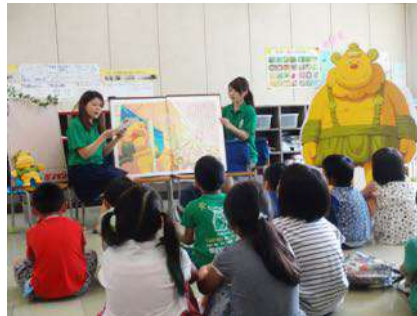
従業員による絵本の読み聞かせ会

※日本中の子どもたち、お母さんやお父さん、おばあちゃんやおじいちゃんが気軽に手に取ってもらえるように、全国のセブン-イレブン店舗やデニーズ、ヨークベニマル、赤ちゃん本舗などで偶数月に約80万部発行し、無料で配布しています