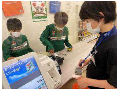
品川スチューデント・シティ

セブン-イレブン・ジャパンは、2003年から東京都品川区と公益社団法人ジュニア・アチーブメント日本が協業で開催している「品川スチューデント・シティ」に出店しています。これは小学校の中に仮想の街をつくり、さまざまな企業が出店する中で、就業および社会体験の機会を提供するものです。子どもたちは、セブン-イレブン店内で接客から売場づくりなどを体験することで社会の仕組みを学びます。