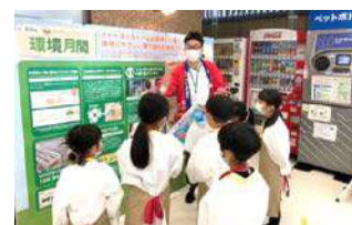
SDGsの視点で学べる「ちびっこ職場体験ツアー」