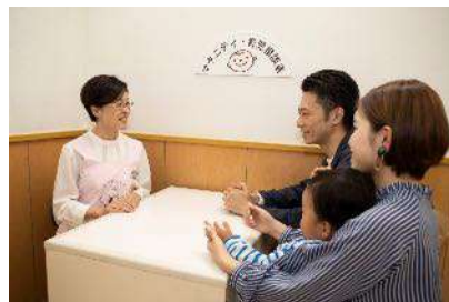
育児に関する相談窓口

イトーヨーカドーとそごう・西武は、保健師や助産師の資格を持つ相談員が妊娠中の健康や育児について無料で相談を承る「マタニティ・育児相談室」を100店舗、「プレママステーション」を5店舗、それぞれ設置しています（2022年2月末現在）。各施設では、おむつ交換台や授乳用個室、ミルク用給湯器、子ども専用トイレなどを備えた休憩室をご利用いただけます。また、相談員が地域の行政で実施している支援についての情報を収集し、利用者の方への情報提供も行っています。