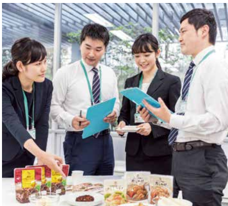
メーカーやベンダーなどがチームを組んだ商品開発

プライベートブランド「セブンプレミアム」では、盛り付けるだけ、焼くだけなどの簡単調理の惣菜メニュー、レンジ調理のみで簡単便利な冷凍食品など、家事の手間やわずらわしさを解決して、お客様のニーズに応える商品を開発しています。また、セブン-イレブン・ジャパンでは、食材本来の美味しさを追求するとともに、保存性が高く、電子レンジで加熱して食べることができるメニューを開発しています。