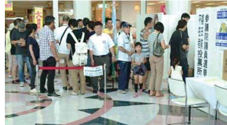
店舗内に設置した投票所

合計で20店舗に投票所を設置し、店内ポスターの掲示や店内放送、レシートへの印字などの告知による選挙の啓発活動を行いました。