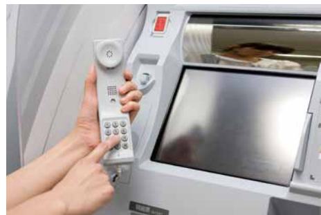
音声ガイダンスサービス

* セブン銀行と提携している銀行、信用金庫、信用組合、ろうきん、JAバンク、JFマリンバンク、証券会社など。なお、生命保険会社、クレジット会社などの上記以外の金融機関は提携していても対応していません。