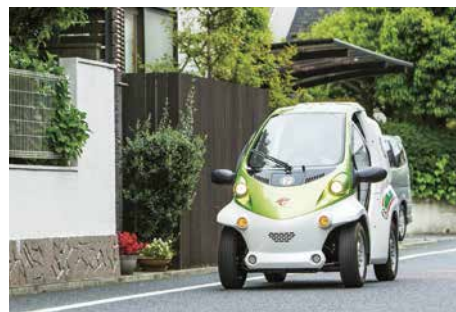
セブンらくらくお届け便