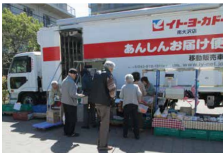
イトーヨーカドーあんしんお届け便