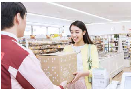
商品をお届けの際もお買物をサポート

店舗での販売はもとより、パソコンやスマートフォンで商品をご注文いただけます。また、パソコンに不慣れな方には店員がお手伝いしたり、外出のできない方には御用聞きに伺ったりと、お客様のご都合の良い方法で欲しいものが購入いただけるショッピングスタイルを目指します。