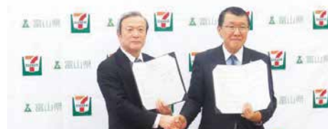
富山県との包括連携協定締結式