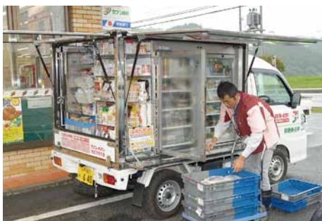
セブンあんしんお届け便

また、イトーヨーカドーでも、独自に開発した販売設備付きトラックで巡回する移動販売「イトーヨーカドーあんしんお届け便」を、長野県、札幌市、多摩市、花巻市、いわき市の5店舗で運行しています(2016年5月末現在)。