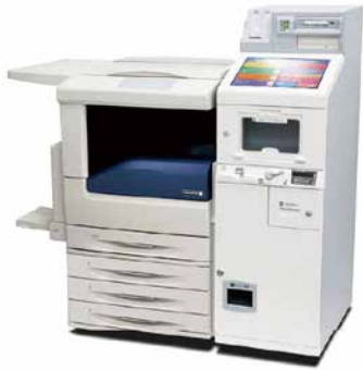
マルチコピー機で各種証明書を発行できます

現在、グループ各社でも同様のサービスをご利用いただけるように、マルチコピー機の導入を進めています。