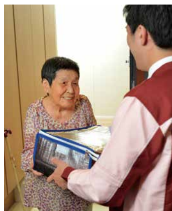
お食事をご自宅までお届け

2016年3月から、勤務形態が多様化するなど、食事時間が不規則な職場が増えていることへの対応として、法人向けに、「セブンミール」の日替り弁当や食料品を配達するサービスを本格的に開始しました。法人向けのサービスは、首都圏600店舗から開始し、順次拡大しています。