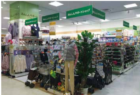
あんしんサポートショップ

イトーヨーカドーでは、高齢者の生活と健康をサポートする商品から介護商品まで、衣料品・生活用品・食品をトータルにそろえる「あんしんサポートショップ」を110店舗で展開しています(2016年2月末現在)。販売している商品の約4割が、お取引先と開発したオリジナル商品で、販売時には専門の資格を持つ販売員が商品のご案内をすることに加え、介護や福祉全般に関する相談を受け付けています。