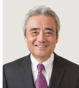
代表取締役社長 最高執行責任者 (COO)

特定した重点課題の中の一つに、少子高齢化や女性の社会進出、生活拠点の空洞化といった課題があります。これに対しては、ステークホルダーとの対話を通じて、お客様のご不便を少しでも解消するために、「近くて便利」なお店を目指しているセブン・イレブンの出店を拡大するとともに、現代の「ご用聞き」としてイトーヨーカドーの「ネットスーパー」やセブン・イレブンの「お届けサービス」などご家庭への配達サービスを行っています。また、ご年配の方にとっては食事をつくらしたり、片づけたりするのは大変な手間であり、少しでも家事の軽減につながればと、グループ共通のプライベートブランド「セブンプレミアム」を中心に、簡単に調理ができる商品を開発しています。