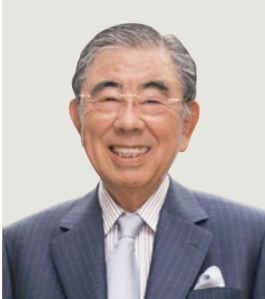
代表取締役会長 最高経営責任者 (CEO)