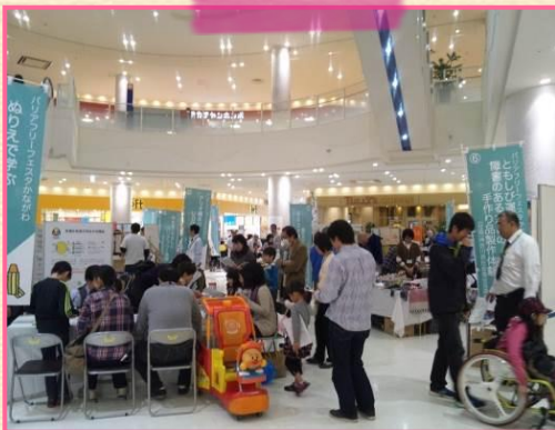
店内のイベントスペース「アクアガーデン」には、11のコーナーが出展