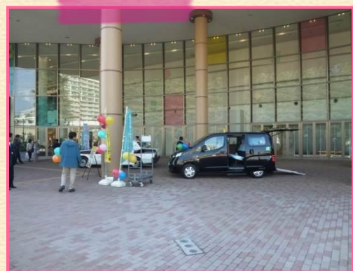
屋外の「フロントガーデン」には、UD(ユニバーサルデザイン)タクシー紹介コーナーと補助犬のお仕事の紹介やふれあいコーナー