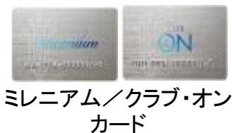
ミレニアム/クラブ・オン カード