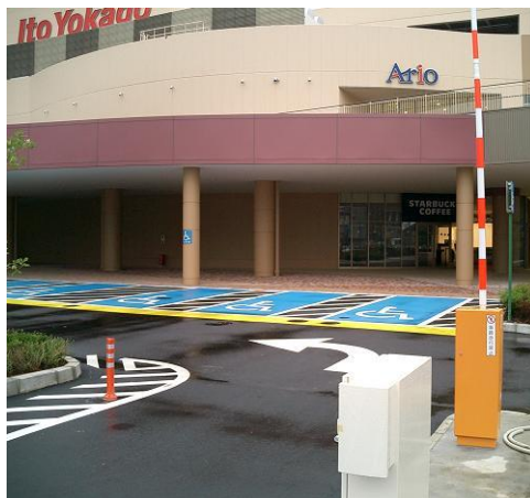
[車椅子利用者専用駐車場]