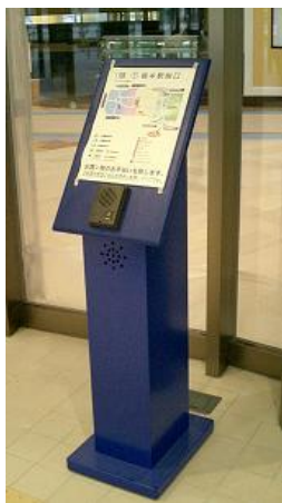
[お問い合わせコール]