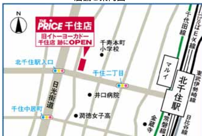
< 店舗ご案内図 >

店舗面積：約 4,100 m 2 従業員数：計 128 名(社員 20 名、パート 108 名) 売上目標：約 50 億円(初年度計画) 商圈設定：半径 3km 圏、約 41 万人