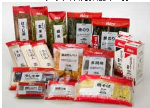
<PB『ザ・プライス』食料品の一例>