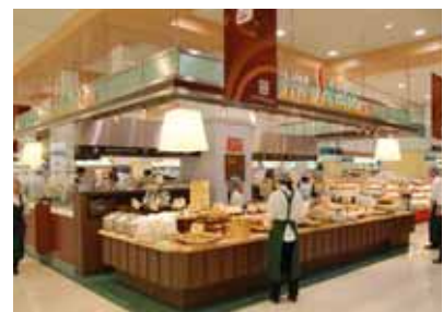
「咲菜」店舗イメージ