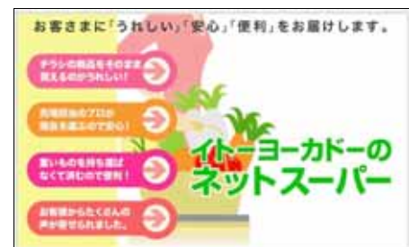
ネットスーパー画面イメージ