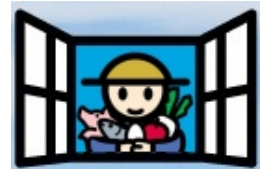
「顔が見える食品。」ブランドロゴ