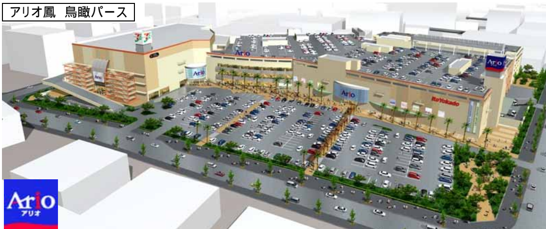
アリオ鳳 鳥瞰パース

当出店地は、JR 阪和線鳳駅から南へ約 800m、同 富木駅から北東に約 800m の堺市南西部に位置し、府道大阪和泉南線（府道 30 号）に面した交通アクセスの至便な立地です。また計画地周辺は半径 5km 内に約 50 万人の潤沢な人口を有する地域です。