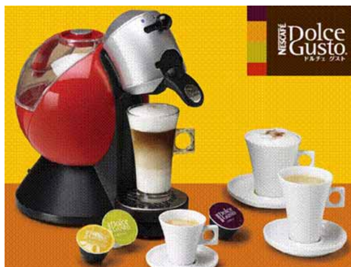
写真:「ネスカフェドルチェ グスト」

セブン&アイ・ホールディングスは、こうしたネスレ日本の取り組みに賛同するとともに、手頃な価格で本格的なコーヒーをお楽しみいただける新製品「ネスカフェドルチェ グスト」を付加価値の高い商品と位置づけ、今後販売エリアを順次拡大してまいります。とりわけセブン-イレブンでは、従来のコンビニエンスストアにおける品揃え・取り組みの枠を超えるまったく新しい差別化商品として、積極的に販売してまいります。(文中店舗数は2008年1月末現在)