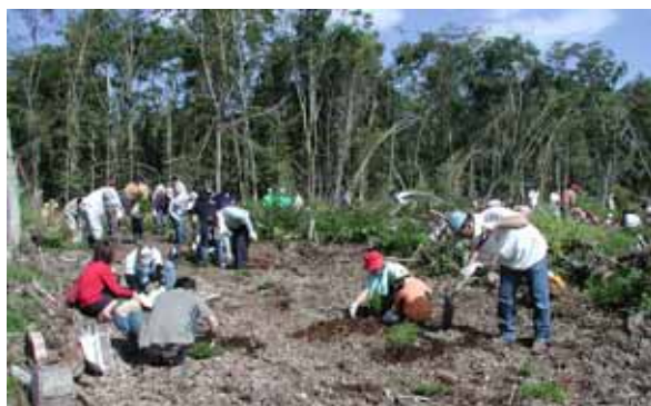
セブン-イレブン支笏湖の森づくり 植樹風景・植樹完了