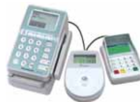
< マルチリーダーライタ(読取端末機) >