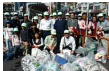
写真は昨年の清掃の実施風景