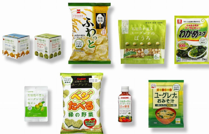
【ユーグレナ入り商品】

今後もユーグレナ社とイトーヨーカドーは、他の食品メーカーのご協力を得ながら、栄養面で優れた付加価値の高い商品開発を推進し、全国のイトーヨーカドーでのユーグレナ入り商品の展開を通じて、日々のお客様の健康面におけるサポートに努めてまいります。