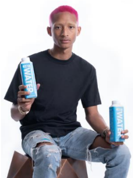
ジェイデン・スミス