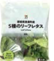
宮城県美里町産5種のリーフレタス