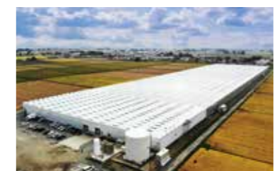
「美里グリーンベース」全景 独自の栽培システムとさまざまな新技術を導入し、一年中安定した生産・供給を可能にしています。

た光源による植物の成長を可能にし、天候不順の影響を受けない環境を整えることで、安全・安心で安定的な野菜の供給を実現しています。最新の技術と設備を用いた持続可能な農業の実現を目指す取り組みと、セブン&アイグループが掲げる持続可能な原材料調達目的が合致し、商品化につながりました。活用の幅を拡大し、今後も安全・安心な商品を提供していきます。