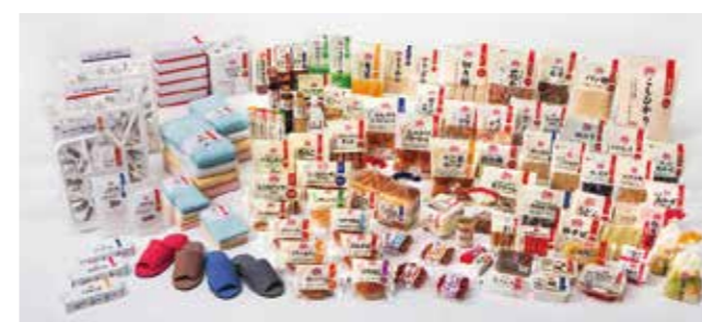
「ザ・プライス」の特長 1. デザインの色数を少なくしコストを削減 2. 物流と生産効率を上げて価格に還元 3. シンプルな商品づくりを追求(納豆のたれやからしを入れないなど)