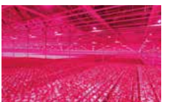
最新鋭のLEDを採用した栽培の様子。