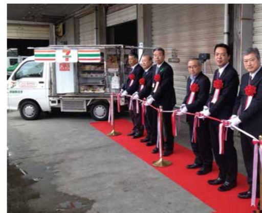
移動販売車セレモニーにて。

5月9日、愛媛県で初の取り組みとなる移動販売でのお買物支援「セブンあんしんお届け便」の運用を、セブン・イレブンJA五十崎支所前店で開始しました。販売商品は、おにぎりや加工食品、冷凍食品など約150アイテム。月曜日から金曜日まで内子町内のJAの支所、公共施設等で販売します。