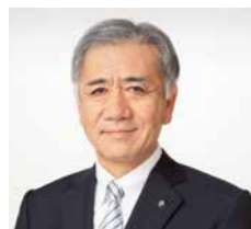
セブン&アイHLDGS. 代表取締役社長

グループとしての大きな方向性を全体で共有しながら、一人ひとりが持ち場に合ったPDCAサイクルを日々愚直に実践していく強い組織づくりに向けて、全力を傾注してまいります。