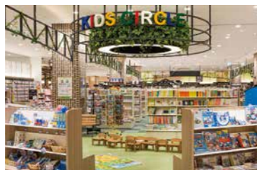
紀伊國屋書店の児童書コーナーでは定期的に読み聞かせイベントを実施しています。

外壁全体に、実際の凹凸があるように見えるレンガづくりのだまし絵が、20人のアート職員が4カ月かけて描きあげました。