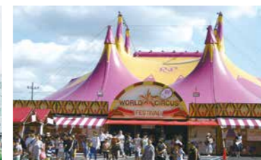
セブンパークではさまざまなイベントが行われています。9月4日までは、ファンタジックな世界を堪能できる「ポップアップサーカス」の特設テントが登場。

セブンカフェーナッツやペットボトル、時計など実物の20倍大の巨大オブジェが並ぶユニークな室内空間「ビッグ・ワンダー」では子どもも大人も童心にかえって楽しむことができます。