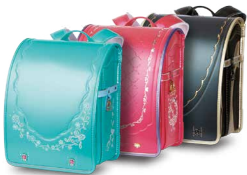
高い機能性に加え、イトーヨーカドーだけのオリジナルデザインとカラーが特徴。最大47,850通りのパターンから選べるオーダーメイドも人気です。