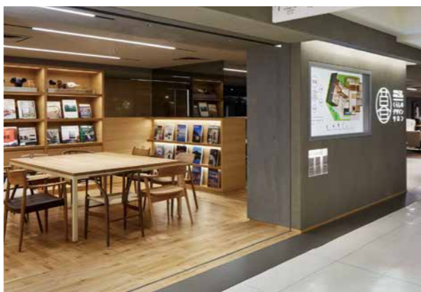
西武池袋本店7Fに開設されたサロン。

6月30日、セブン・イレブンは、全国初となる自治体の有人インフォメーションセンターを併設した店舗「セブン・イレブン船橋駅南口店」をオープンしました。高齢社会の進行や単身世帯の増加