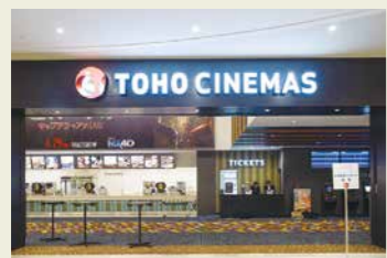
4Dシアターで五感を刺激する体験を。