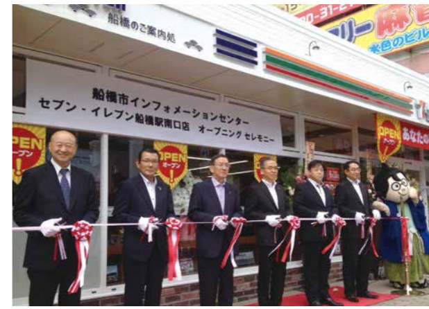
6月29日に行われたオープニングセレモニー。

女性の就業率の上昇、中小小売店舗の減少など、社会環境の変化に対応し、船橋市とも高齢者等の見守りに関する協定を締結。「近くて便利」なお店づくりを推進して品揃えやサービスを拡充するとともに、自治体の専属スタッフの常駐により、地域や行政とさらに密な連携を図っていきます。