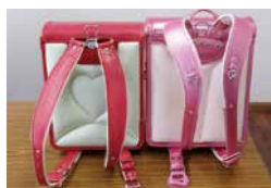
右のランドセルは、「天使のはね」が肩ベルトを持ち上げ、「3D肩ベルト」が内側にカーブを描いていることがよくわかります。