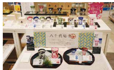
各売場では、千葉県産のこだわり商品も揃えています。