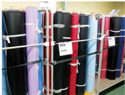
ずらりと並んだランドセルの生地。イトーヨーカドーでは195種類のカラーから選べ、女の子にはパールカラーのピンクやブルーが人気。