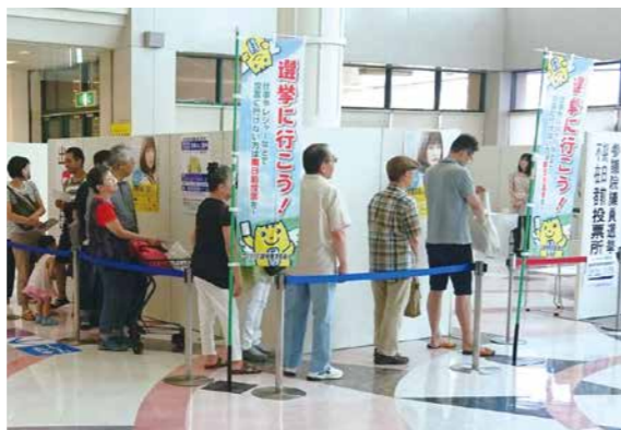
期日前投票には、お買物ついでに多くの方が立ち寄られました。

6月24日、西武池袋本店では、50代以上の大人の暮らしと住まいづくりをサポートする「Good Over 50's」からのデザインサロンを開設しました。「Good Over 50's」は、年齢を重ねても自分らしく暮らすために50代のうちから準備をするという考え