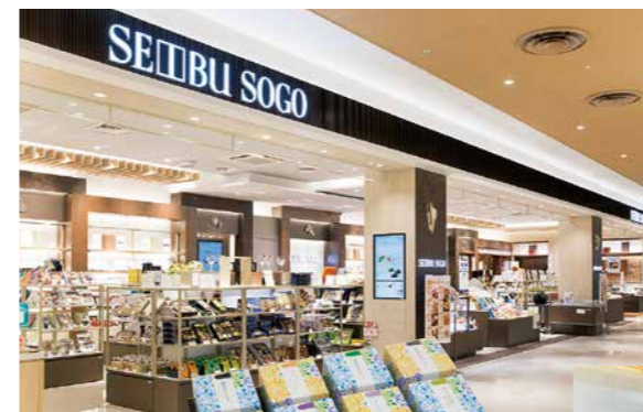
「西武・そごう柏ショップ」では日本各地の銘菓・ギフト商品を取り揃えています。同じフロアにはセブン-イレブンも! 12時間営業ですがセブンカフェは1日に600杯出ることあり、多くのお客様にご利用いただいています。