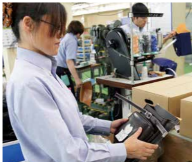
前ポケットと後ろの仕切部分の張り合わせを確認。ここで1ミリの誤差があると、最後に4ミリのズレが生じるので、チェックする目は真剣そのものです。