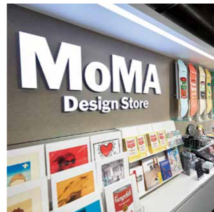
「MoMA Design Store」渋谷ロフト。8月には仙台ロフト内にもオープン予定。

「MoMA Design Store」のショップインショップが、渋谷ロフト(4月20日)と池袋ロフト(4月29日)にオープンしました。「ニューヨーク近代美術館MOMA」は、20世紀以降の現代美術の発展と普及に多大な貢献をもたらした、日本でも人気の美術館。「MoMA Design Store」は、美術館のアートを選定するキュレーターが選び抜いたプロダクトが揃ったミュージアムショップです。2007年オープンの海外1号店(東京・表参道店)に続き、ショップインショップとしては今回が初の出店。ロフトとMOMAが共同開発したショップインショップ限定アイテムも揃っています。