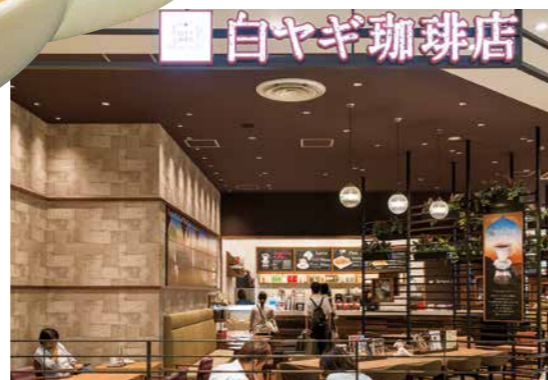
昔々、ヤギ飼いの少年が、山の赤い木の実をヤギがおいしそうに食べているのを見つけました。店名は、そんな珈琲誕生に関わる伝説に由来。レトロな紋章がお店の目印です。