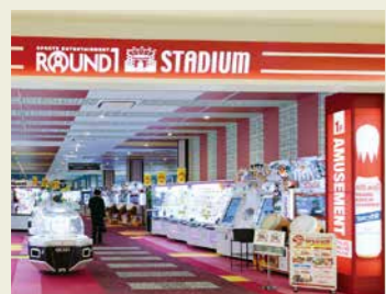
スポーツ、カラオケ、ゲームなどが一カ所で楽しめます。