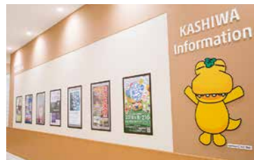
店内には柏市の自然やイベントを紹介するギャラリーも。