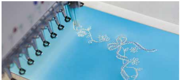
デザインと色を指定して、コンピュータに打ち込んで行う刺繍の作業は、姫路工場で行っています。