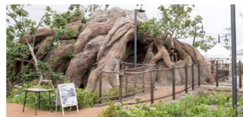
「スマイルパーク」にある切り株を模した巨大なオブジェ「切り株テラス」。バーベキューガーデンが併設されています。