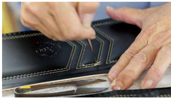
縫い目からのぞいた糸の毛羽も、目打ちを使っていねいに処理していきます。