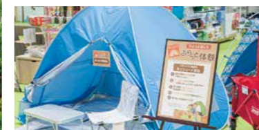
パークでは、イトーヨーカドーに展示してあるサンシェードやジョギングシューズのお試し体験もできます。

人工芝を敷き詰めた約4,000坪の「スマイルパーク」は、上空から見るとスマイルマークに。店内で購入したお弁当を広げたり、水場や遊具、ドッグランで遊んだり、さまざまな楽しみ方ができます。公園にはバーベキューゾーンが隣接しています。