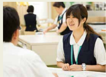
便利な使い方をご紹介します。