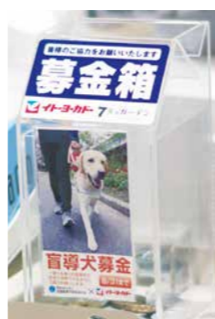
約6,000台のレジに設置。募金のテーマは3カ月ごとに変わります。

第2弾となる6月から8月は、「全国盲導犬施設連合会」への寄付を目的とした店頭募金を実施。今後ともさまざまな社会的課題に対応する募金活動を通じて、地域に密着した社会貢献の窓口としての機能を高め、お客様と一体となった社会貢献活動を推進していきます。