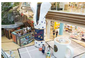
リアルな巨大オブジェが立ち並ぶ様子は一見の価値あります。