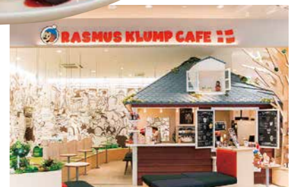
デンマークで国民的な人気を誇るキャラクターカフェ「ラスムスクルンプカフェ」が日本初出店! チボリ公園をイメージした空間です。