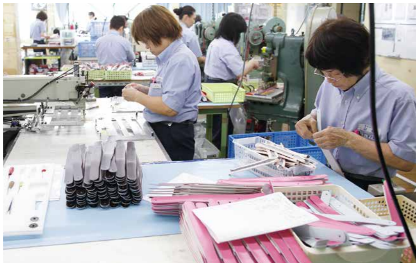
ブルーのボタンダウンシャツにネイビーのパンツ。働く人々の制服もオシャレで、雰囲気も明るい工場。