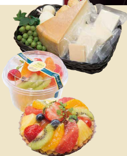
イトヨーカドー初の専門コーナーとして「スイーツステーション」を展開。お客様のご要望に応じた商品も承ります。

都会の街並みを彷彿とさせるシックなカラーを基調にモダンで洗練されたデザインの「イースト・ウィング」。自然のやさしさをテーマに、森をイメージさせるカラー、木の素材感や曲線を活かしたデザインの「ウエスト・ウィング」。2つの異なるイメージを持つ商業ゾーンがお客様をお迎えます。