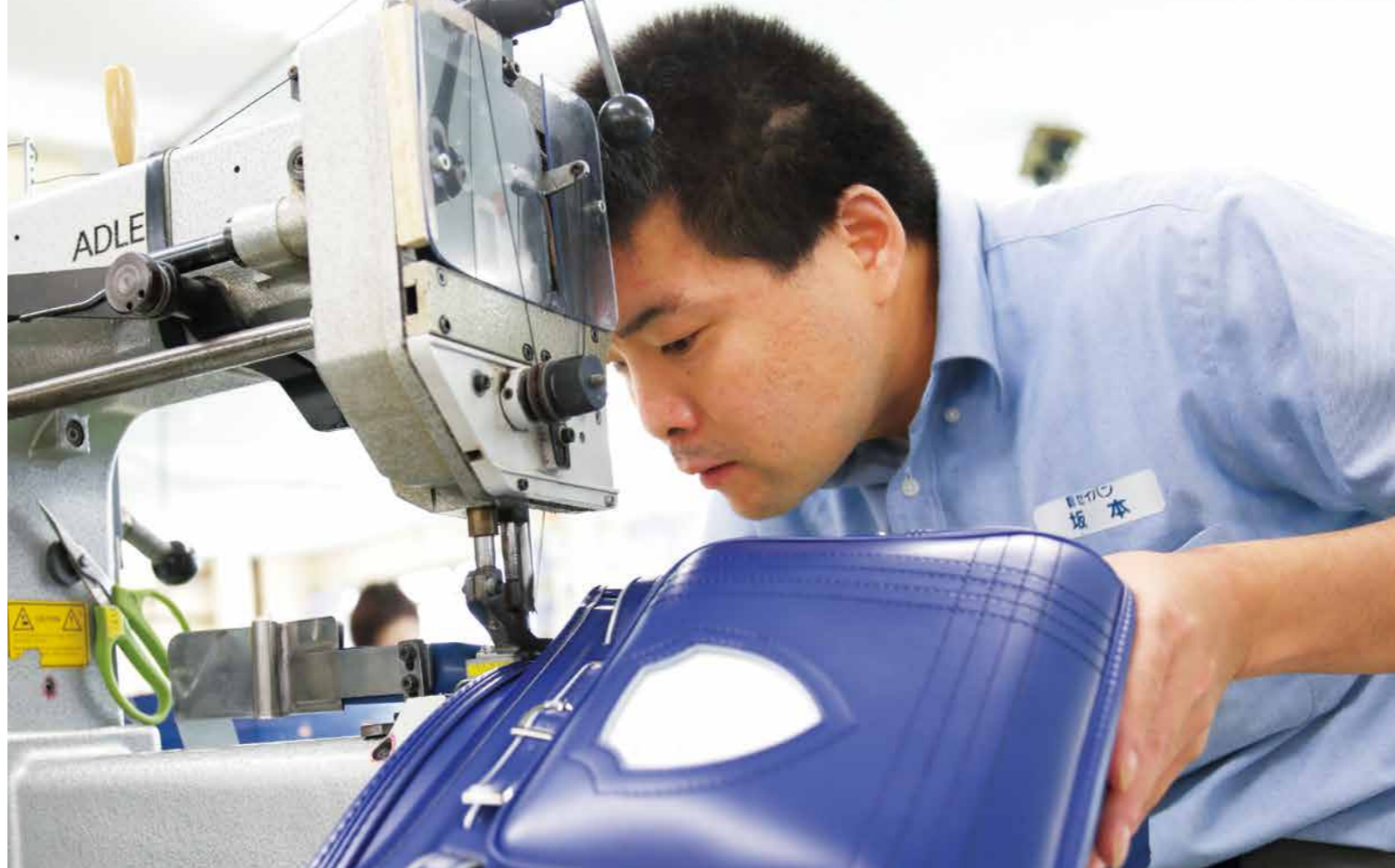
立体的な鞆にミシンをかけるには、職人の技量が必要。踊るように大きく体をくねらせ、あっという間にランドセルが完成していきます。