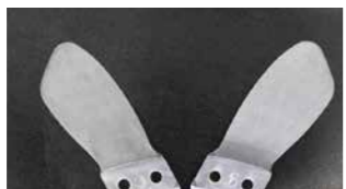
「6年間絶対に折れません」とランドセルマイスターが絶対の自信を誇る「天使のはね」。