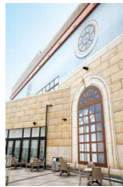
遊び心あふれる外観デザインも担当。

ネーションの中で遊ぶことが大好きでした。そんな楽しみを多くの人々と共有したいと考えたのです。テーマは「家庭のテーブル」。フロアをテーブルに見立て、その上にお菓子や飲み物、ブリキのおもちゃやチェス、書籍など、暮らしに身近なモノを、20倍のサイズでリアルに再現、配置することで、大規模ショッピングセンターならではの解放感あふれる楽しさを五感で感じてもらおうと思いを凝らした。小人になった気分、思わず写真を撮りたくなるようなスペースになっています。●また、その感動を身近な人に伝えていただき、次は一緒に来店いただけるよう、楽しい写真が撮れるスポットを表示したりフォトコンテストを実施するなど、SNSを活用した「人が人を呼ぶ仕掛け」も提案しました。こうした一連の施策は好評で、集客に貢献