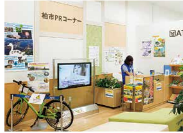
行政コンシェルジュが柏市の魅力をご紹介します。