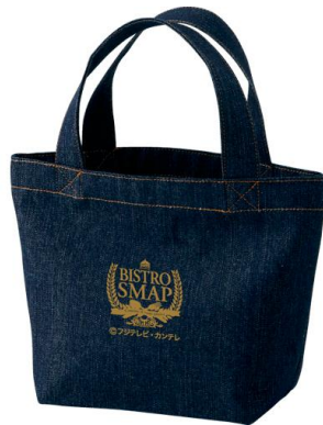
デニムランチトート