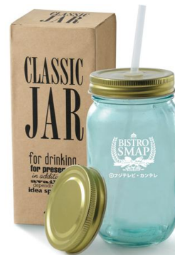
クラシックジャー