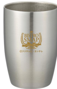
真空ステンレスカップ 250ml