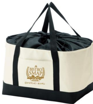
保温冷たっぷりお買い物バッグ