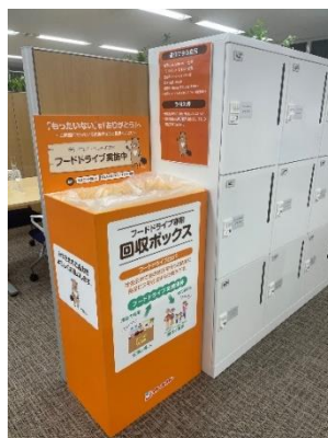
寄付回収ボックスイメージ