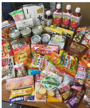
寄せられた食品（例）