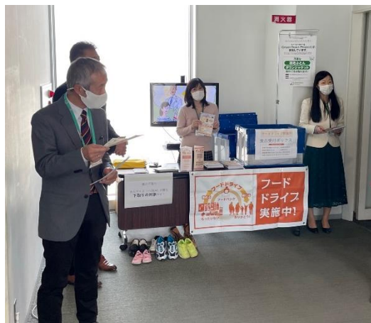
フードドライブを呼びかける様子