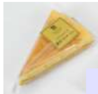
ロどけなめらか 濃厚フロマージュ 150円