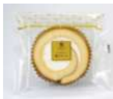
3つのヒミツ! 極上ロール 150円