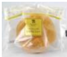
ミルクたっぷり とろりんシュー 105円