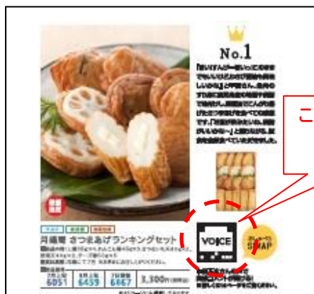
夏ギフトカタログ

※「セブン&アイの夏ギフト」カタログは承り期間中、セブン-イレブン、イトーヨーカドー、西武・そごう各店の店頭にてご用意しています。