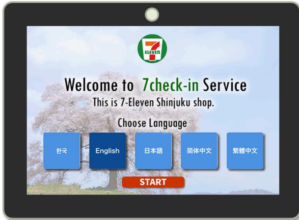
チェックイン画面