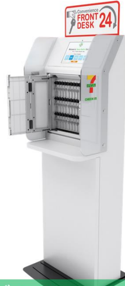
セブンチェックイン機 (イメージ)