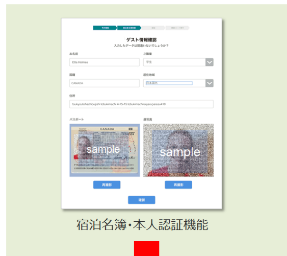
宿泊名簿・本人認証機能