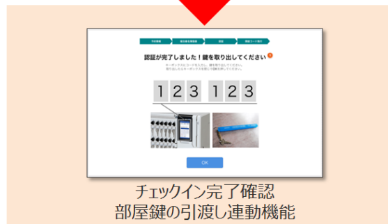
チェックイン完了確認 部屋鍵の引渡し連動機能