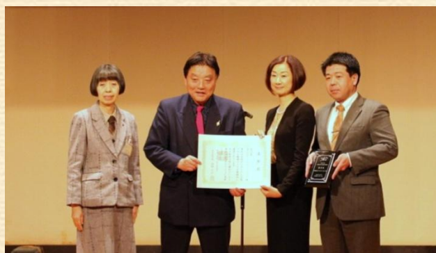
名古屋市 河村市長より表彰状と楯を 授与していただきました