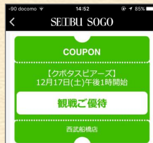
当日観戦チケットの割引クーポンも配信