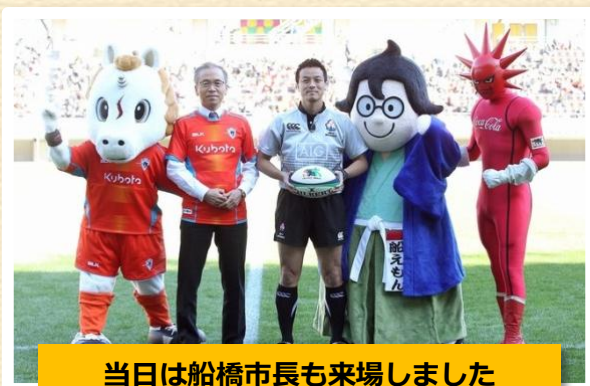
当日は船橋市長も来場しました