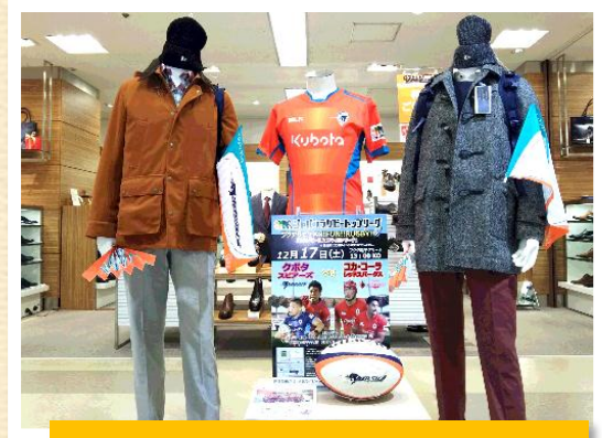
ユニフォームとあわせた展示