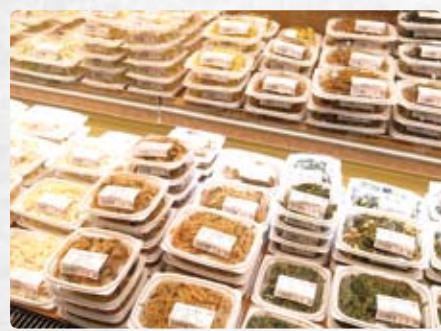
単身のお客様が増えたことに対応し、少量パックの惣菜を充実。

ヨークベニマルは福島・宮城・山形・栃木・茨城5県でさらにドミナント展開を進め、今年度12店、来年度13店、再来年度15店の新規出店を予定。地域の皆様とともに歩み、暮らして楽しさと豊かさを提案し続けていきます。