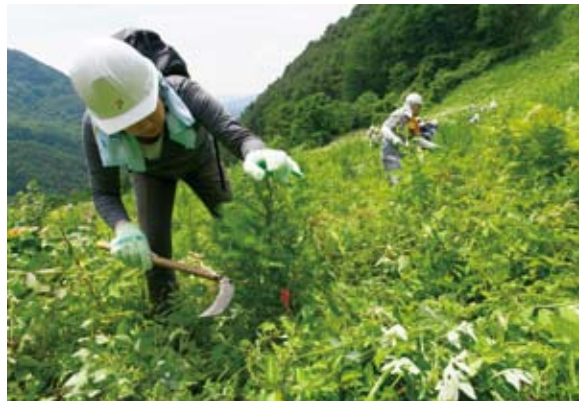
南条生産森林組合が所有する山林200haのうち、今回は1~2年前にスギやカラマツが植林された、3haのエリアの下草刈りを行いました。作業を通じて、環境やボランティアに関する社員の意識向上とともに、グループシナジーの追求も図っています。

今年度中には長野県以外の候補地も選定し、さらにプロジェクトを拡充していく方針です。