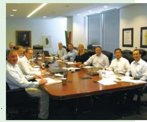
日本からの社員も加わったセブン-イレブン・インクの幹部ミーティング。