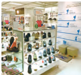
スポーツシューズの実に7割の売上げを誇るウォーキングシューズ売場(そごう横浜店)。