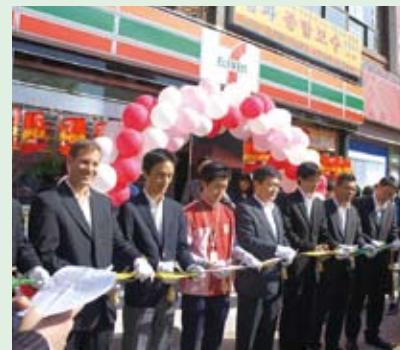
韓国のモデル店舗オープニング風景。

ン-イレブンを展開するコリアセブンへの支援をスタート。ライセンスリーのセブン-イレブン・インク、コリアセブン、SEJの3社間で契約を結び、①SEJより店舗運営等のビジネスプロセスの支援や指導、②モデル店舗の開設、③SEJによるコリアセブンの幹部候補社員の研修受け入れという3点を骨子とした支援を進めています。