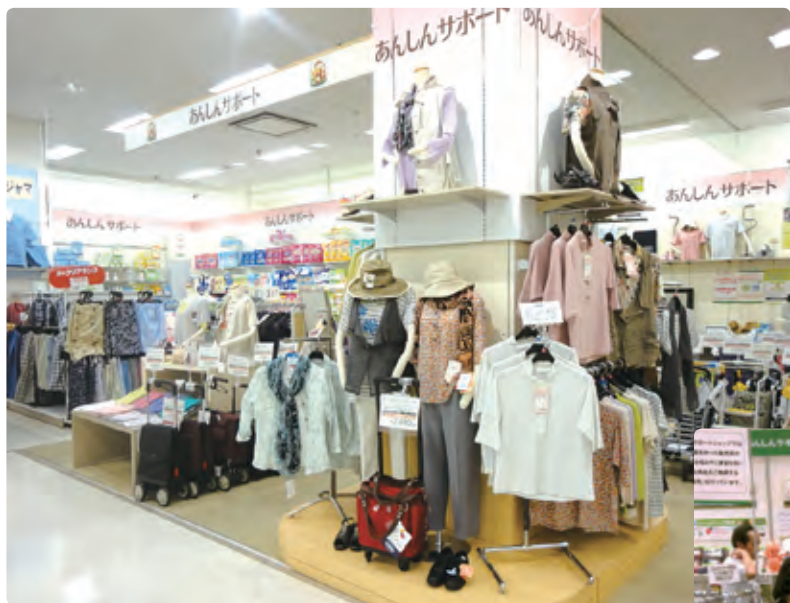
ファッションを前面に打ち出した「あんしんサポートショップ」。昨年7月のリニール後は2ケタ成長を続けています。

売場では「着やすい、脱ぎやすい、動きやすい」といった機能性を備えつつ、トレンドも取り入れたファッションを前面に打ち出してアピール。ファッションに関心が高いシニアを中心に、新たなお客様が増加中です。約1200ある扱い商品の約6割がオリジナル商品で、東日本大震災を機に防災用としても注目を集めるアイテムをはじめ、