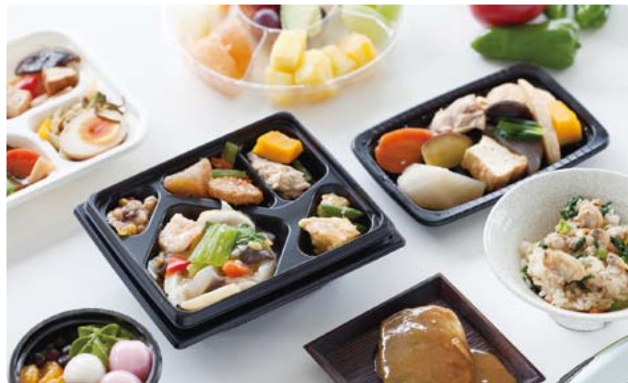
セブンミールのお弁当。管理栄養士が監修し、カロリーや塩分など栄養バランスが配慮されているので、シニアのお客様にも安心して召し上がっていただけます。

「近くて便利なお店」をスローガンに掲げて3年。お客様に「距離」だけではなく「精神的」な近