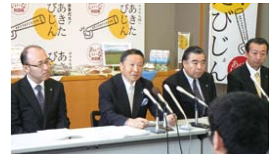
秋田県初出店に際し、記者会見を行うセブン-イレブン取締役常務執行役員(左から2人目)。

5月31日、秋田県へ初出店し、横手市、美郷町に3店舗が同時オープンしました。2013年には秋田市内への出店も予定しており、2014年度中には秋田県へ累計100店舗の出店を目指していきます。