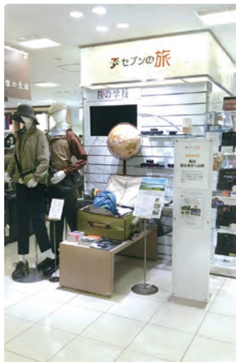
「モノ」だけでなく「コト」提案を行うことで、シニア世代のこだわりに応える旅行関連売場。

これまでにない提案の実現には、従来の縦割り組織では限界があるとの考えから、この5月、社内に「アクティブシニアプロジェクト」を発足。領域を超えて