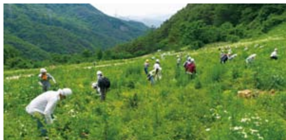
全員が鎌を手に、下草刈りの作業にたっぷり汗を流しました。当日は長野放送 (FNS 系列) や信濃毎日新聞も取材に訪れました。