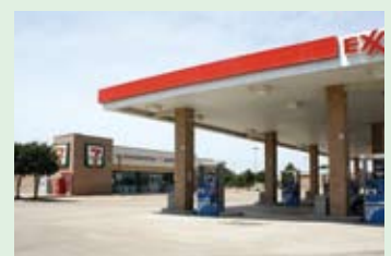
アメリカのガソリンスタンド併設型の店舗。

SEJはセブン-イレブン・インクへの支援を強化すべく、この7月に新たに店舗運営および商品政策それぞれに精通した幹部級の社員と若手社員合わせて6名を派遣。商品面ではサンドイッチなどのフレッシュフードの強化をサポート。店舗運営面では、単品管理や接客サービス等のレベルアップを図り、商品改革とも連携しながらストアロイヤルティの向上を目指してい