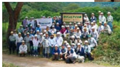
初日は、アリオ上田店ほかグループ社員22名。2日目は本部社員30名に加え、長野地区のセブン・イレブン社員など27名が参加しました。