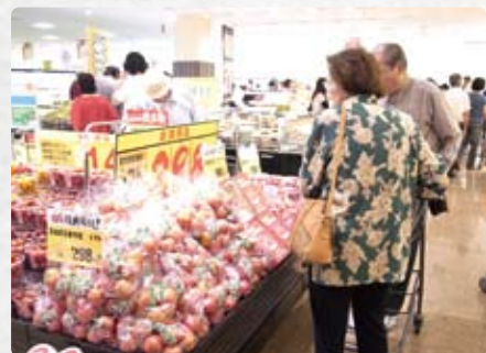
地場野菜を集積したコーナーを設け、地元のお客様のニーズにお応えしています。

高級魚やお造りを日々取り揃えています。精肉売場では国産和牛を充実させ、食卓に彩りを添えます。仮設住宅の手狭なキッチン事情や護岸工事で単身滞在中の建設会社の従業員が多いことを考慮し、少量・適量パックの惣菜類や、調理済み・即食商品の品揃えを拡充。衣料売場は目にも楽しい活気ある売場づくりを行っています。