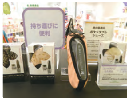
機内やホテルで重宝と人気のバリエーションシューズは、シニアから高い支持を受けています。