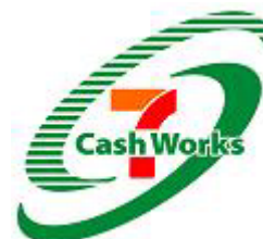
新会社ロゴマーク