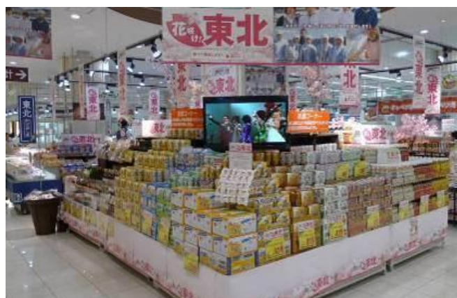
【これまでの「東北かけはしプロジェクト」および売場展開のイメージ】