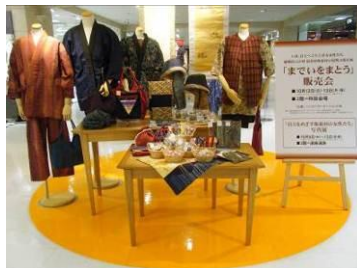
店舗では販売什器を用意し販売。 売上は全額「いいたてカーネーション」 の会へ