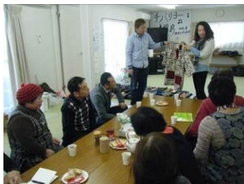
そごう・西武 法人外商が デザインをアドバイス